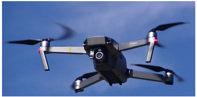
(左)Phantom4シリーズ、(上)Mavicシリーズ